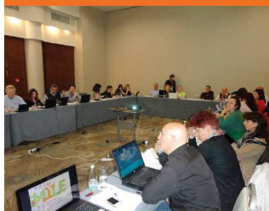
Sofia, 24-25 April 2014