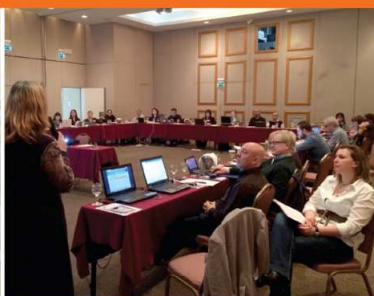
Athens, 26-27 February 2015