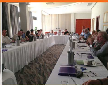
Malta, 23-24 October 2014